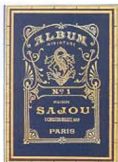
古風な表紙。図案は実際に使えます。